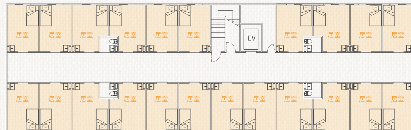
FLOOR GUIDANCE 2F